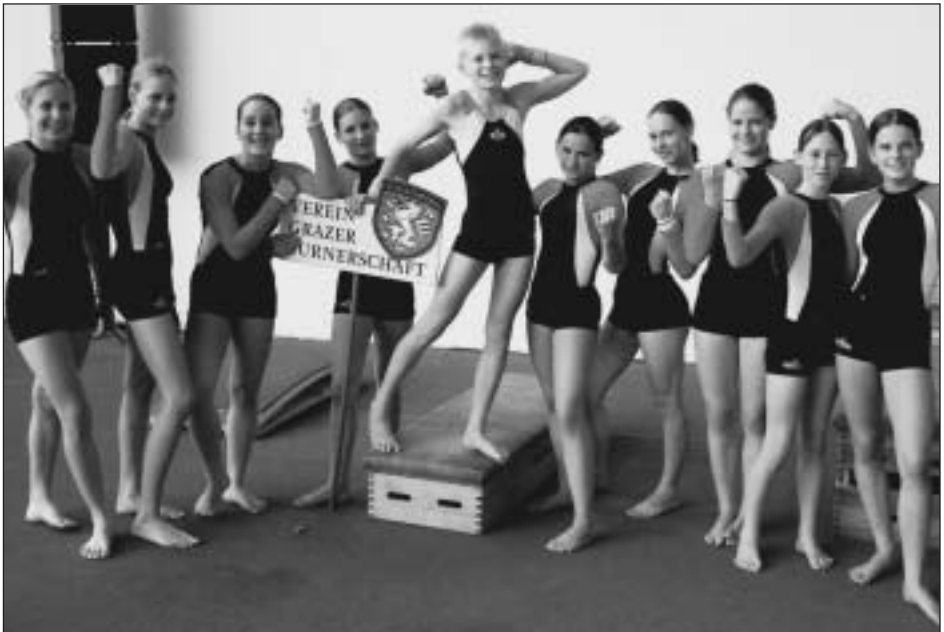
Unser junges Team beim Vorarlberger Landesturnfest.

Der überaus stark besetzte Wettkampf im Team-Turnen-Austria bzw. Euroteam war für uns natürlich der Höhepunkt. Neun Mannschaften aus Deutschland,