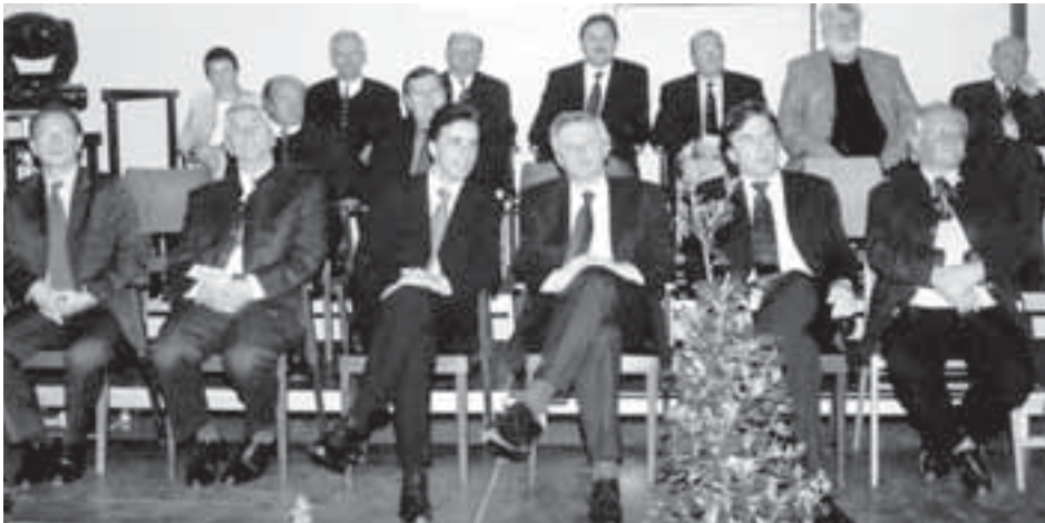
Die Ehrentribüne mit unseren Gästen aus Politik und Sport sowie Funktionäre und verdiente Mitglieder unseres Vereines.

Ein herzliches Dankeschön auch an den Grazer Spielmannszug, der in bewährter Weise die Feierlichkeiten musikalisch begleitete. Natürlich durfte auch der gesellige Teil nicht fehlen und so wurde noch lange nach Beendigung der Auführungen bei Brötchen und Sekt über die äußerst gelungene Veranstaltung diskutiert.