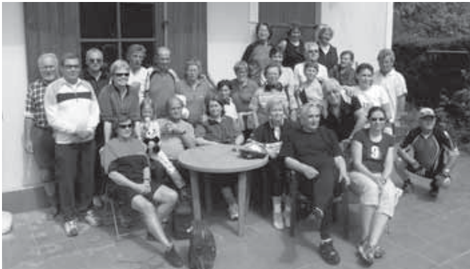
Die Radler bei der verdienten Mittagsrast in Kleinstübing.

Radweg nach Raach weiter, Judendorf und am Freilichtmuseum vorbei, bis nach Deutschfeistritz. In dem Gasthaus in Kleinstübing, wo wir schon einmal nach der Wanderung am Nationalfeiertag schmausten, kehrten wir zu Mittag ein und wurden mit Schnitzel u. Co. versorgt. Die fröhliche Rückfahrt, auf derselben Strecke nahmen wir mit vollem Bauch in Angriff. Wir radelten dem drohenden nächsten Regenguss so schnell wie möglich davon, was uns auch gelang. Alle Sportler kamen gesund, ohne Unfall und glücklich, eine Radtour gemacht zu haben, zu Hause an. Wolfgang