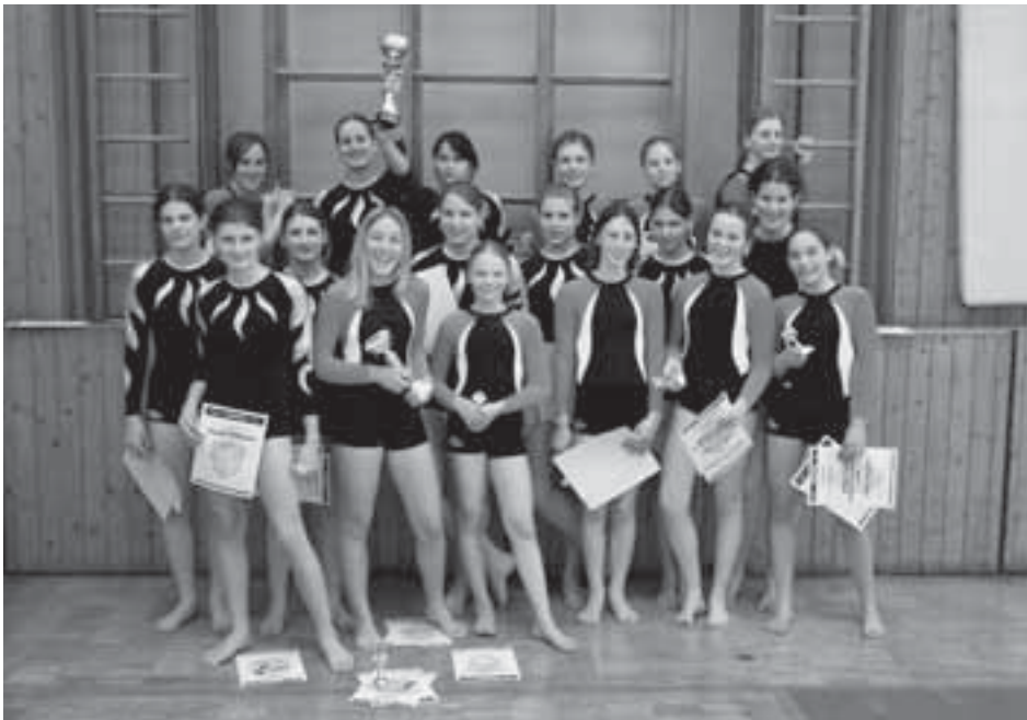
Unsere beiden erfolgreichen und glücklichen Teams nach der Siegerehrung.