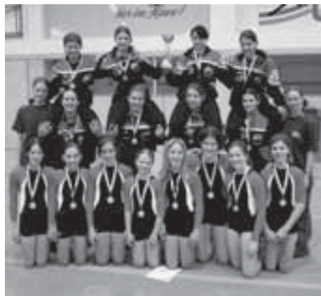
Unsere Teilnehmer beim UWW-Cup konnten sich über die Plätze 2 und 6 freuen.

drei Stürze wertvolle Zehntel gekostet haben. Doch wie so oft, waren uns die Burgenländer am Boden überlegen. Im Endklassement musste sich unser Team gerade mal um zwei Zehntel den Eisenstädterinnen geschlagen geben, konnte aber noch vor den Engländern und Tschechen den ausgezeichneten zweiten Platz erreichen. Ich erinnere an den Wettkampf vor zwei Jahren. Da hatten wir gegen die Teams aus Tschechien überhaupt keine Chance. Was für die Leistungssteigerung dieses Teams spricht. Über den Sommer wird eine neue Bodenkür zusammengestellt. Mit dieser soll es uns endlich gelingen, den Burgenländerinnen die „Schneid“ abzukufen.